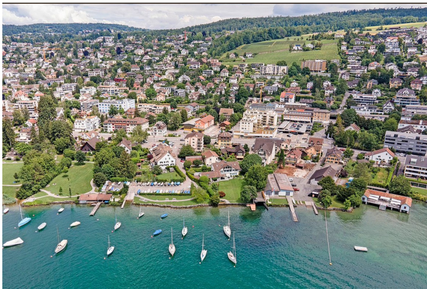
Wollen ihre nachbarschaftlichen Beziehungen intensivieren: Die Seglervereinigung Erlenbach (links) und der Ruderclub Erlenbach.