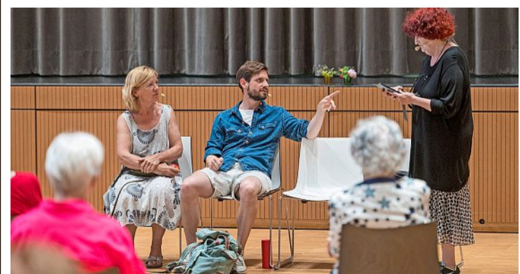
Die Schauspieler vom Forumtheaterzürich präsentieren in Männedorf ein Stück zum Thema Betrug.

Weitere Aufführungsdaten: 7. September in Uetikon, 28. September in Herrliberg und 19. Oktober in Meilen. Die Anlässe wurden von den Gemeinden in Auftrag gegeben und finanziert, unterstützt wurden sie von der Spitex Zürichsee.